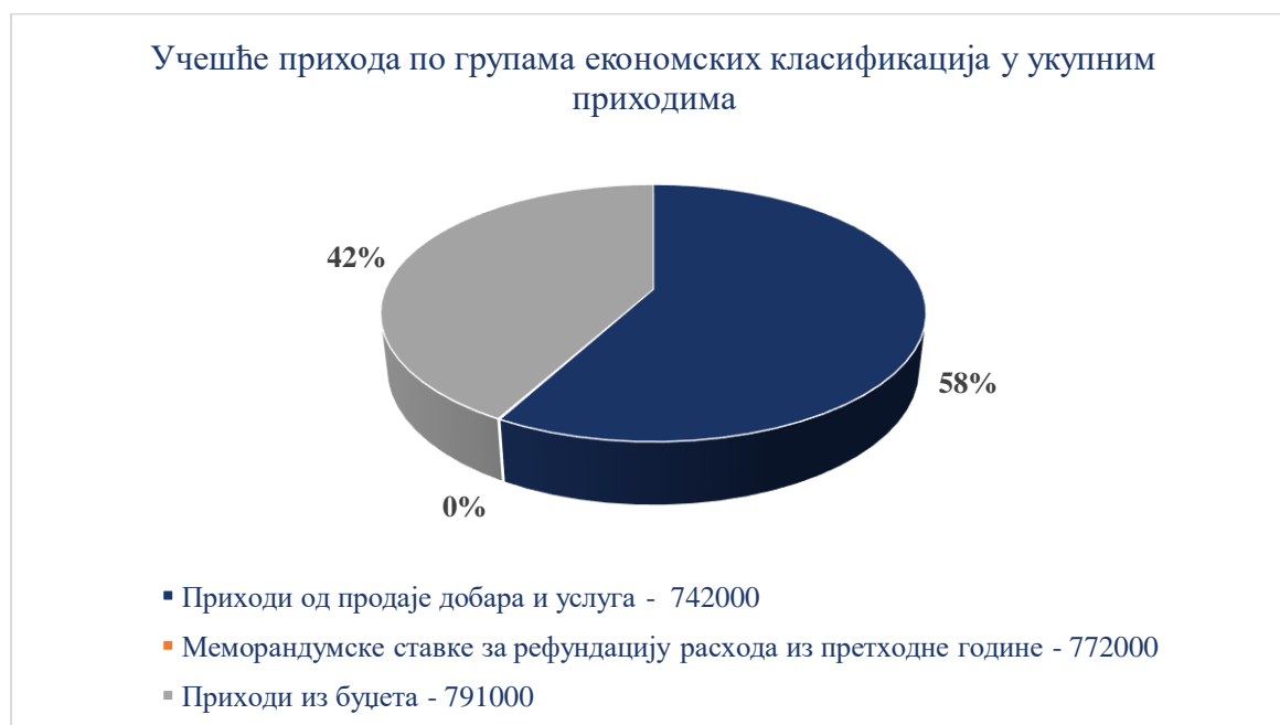
Графикон број 2: Учешће расхода по групама економских класификација у укупним расходима

Учешће расхода по групама економских класификација приказано је у Графикону број 2. а структура расхода у Табели број 8.