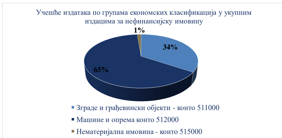
Графикон број 3: Учешће издатака по групама економских класификација у укупним издацима за нефинансијску имовину

Учешће издатака по групама економских класификација приказано је у Графикону број 3. а структура издатака за нефинансијску имовину у Табели број 12.